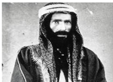
Muhamad bin Abdul Wahab

Wahabiyah adalah suatu bahagian dari firqah Islamiyah dibangunkan oleh Muhamad bin Abdul Wahab (1702M-1787M). Lawannya menamainya sebagai Wahabiyah tetapi pengikutnya menamakan diri mereka "Al Muwahiddun" dan tariqat mereka dinamainya "Al Muhammadiyah". Dalam Fiqah mereka berpegang kepada mazhab Hanbali disesuaikan dengan tafsir Ibnu Taimiyah.