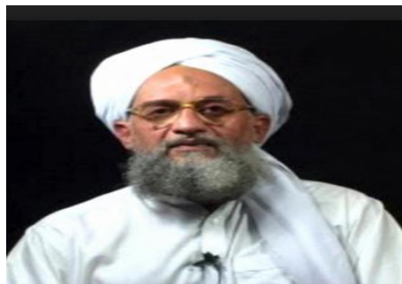
Ayman Al Zawahiri

22. Tokoh-tokoh Takfiri ini adalah Ayman al Zhawahiri dan Abu Muhammad al Maqdisi yang terlibat dengan generasi awal Jamaah Jihad pada tahun 1966 setelah Sayyid Qutb dihukum bunuh. Abu Muhammad al Maqdisi adalah tokoh yang menubuhkan Bay'at Al Imam bersama-sama dengan Abu Musab Al Zarqawy semasa mereka berdua di penjara di Swaqa, Jordan. Bay'at Al Imam inilah yang menjadi Daesh @ ISIS pada hari ini. Maka tidak dapat disangkal lagi apabila kebanyakan literatur menyatakan bahawa elemen radikalisme dan keganasan kontemporari adalah berpunca dari gabungan fahaman Wahabi dengan aliran radikal Sayyid Qutb dan dipelopori oleh Ayman al Zhawahiri semasa di Afghanistan yang merupakan tokoh besar Al Qaeda bersama Osama bin Laden.