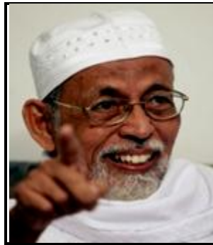
Abu Bakar Ba'asyir

berasaskan daripada pengaruh penulisan ahli falsafah radikal seperti Sayyid Qutb, Al-Maududi dan Nabhani melalui konsep Daulah ataupun Khilafah Islamiyah. 8 Selain itu, golongan fundamentalis ini juga bersifat eksklusif dan menolak semua aspek luar dari lingkungan Al-Quran dan hadis untuk diserapkan ke dalam sistem politik negara Islam kerana bimbang percampuran sedemikian akan menggagalkan matlamat politik mereka. Kegagalan mencapai matlamat fundamentalis dilihat mendorong mereka untuk membenarkan tindakan keganasan ke atas pihak-pihak sasaran termasuk orang awam dan juga kepentingan barat. Pengaruh radikal ekstremis golongan fundamentalis adalah merbahaya dan berupaya mengancam keselamatan sesebuah negara yang memiliki populasi multi-etnik dan mengamalkan konsep demokrasi.