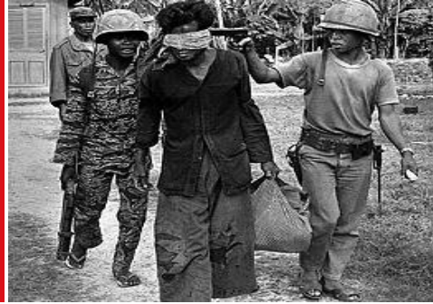
Communist Khmer Rouge