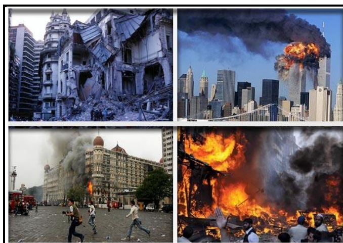
Insiden Serangan Keganasan

Abad ke-21 telah menyaksikan fenomena terorisme menjadi semakin kompleks dan ia mencetuskan dimensi ancaman baru kepada keselamatan antarabangsa. Beberapa kumpulan pengganas baru seperti Islamic State (IS) dan Boko Haram telah muncul di persada global dan kumpulan sebegini dilihat mengambil kesempatan atas situasi politik yang tidak menentu untuk melancarkan tindakan keganasan dan kekacauan ke atas sesebuah negara demi mencapai objektif politik mereka. Apa yang membimbangkan adalah kemunculan kumpulan pengganas seperti IS dan Boko Haram ini telah memberi kesan kepada kestabilan dan keharmonian dalam sesebuah negara tersebut seterusnya berupaya mengubah landskap keselamatan dunia pada hari ini.