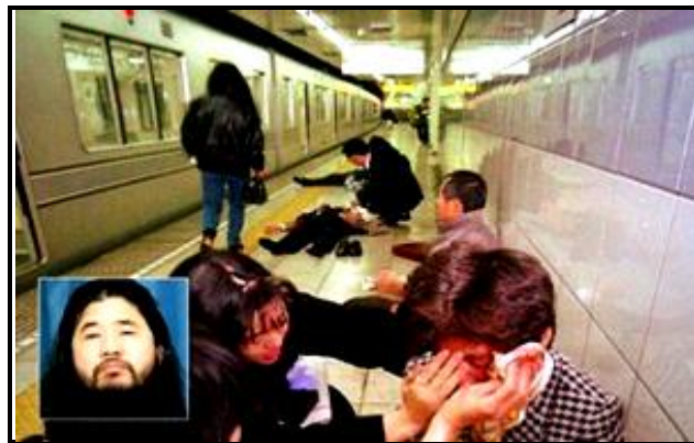
Serangan Kumpulan Aum Shinrikyo di Tokyo Subway System, Jepun

Jepun memberi petunjuk yang signifikan bahawa isu terorisme telah memasuki satu fasa dan dimensi yang baru.