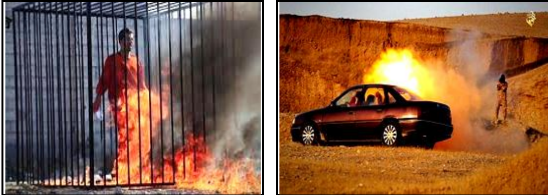
Paparan sinematografi IS yang canggih

Transisi terorisme dilihat banyak dipengaruhi faktor kemajuan teknologi yang lebih canggih. Dalam hal ini, kumpulan penganas menggunakan aplikasi teknologi dalam melancarkan segala aktiviti keganasan supaya lebih mudah, cepat dan licik. Teknologi juga membantu mereka untuk mengelak daripada dikesan oleh pihak berkuasa. Kemudahan seperti Internet berfungsi menyebarkan naratif serta mesej berbau hasutan dan kebencian terhadap kerajaan serta sasaran mereka untuk meraih simpati dan sokongan. Dari segi kepakaran, kumpulan penganas pada masa kini mudah untuk mendapatkan akses dalam bidang ini. Secara lazimnya, kepakaran ini disumbangkan oleh pakar-pakar sains komputer yang berjaya di doktrinasi dengan ideologi penganas. Adalah menjadi kebimbangan sekiranya kumpulan penganas mampu mengakses data-data berdarjah rahsia, maklumat risikan dan pasukan keselamatan yang mana sekiranya berlaku, ia mampu memberi kesan buruk kepada keselamatan sesebuah negara.