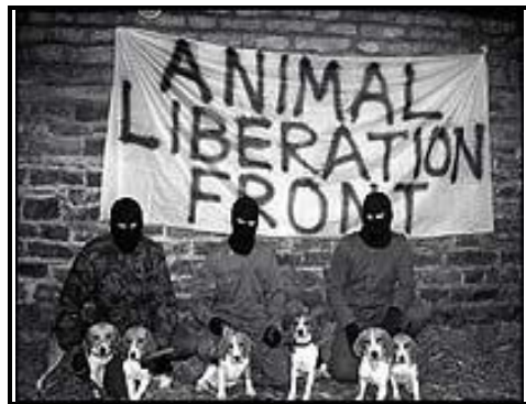
Earth Liberation Front (ELF) dan Animal Liberation Front (ALF)