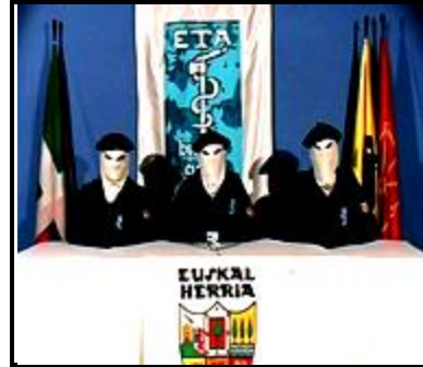
IRA dan ETA