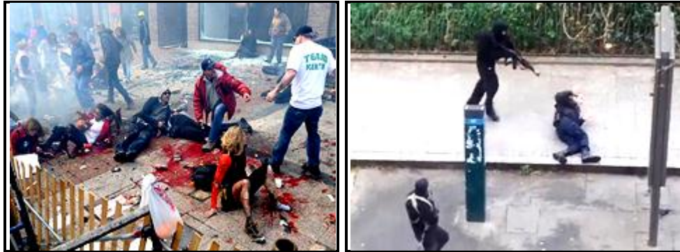
Serangan lone wolf di Boston dan Paris

Liberation Front (ALF) dipercayai bertanggungjawab ke atas pelbagai serangan ganas dan sabotaj di Amerika Syarikat (AS).