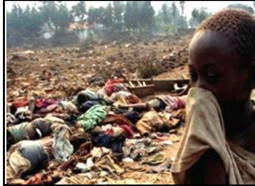
Ethnic Cleansing di Rwanda