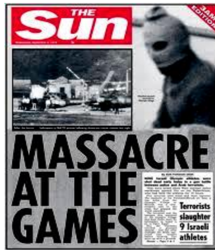
Pembunuhan atlet Israel di Sukan Olimpik Di Munich, Jerman pada 1972

Pengkaji keganasan menyatakan aktiviti-aktiviti keganasan sekitar era 1960an hingga 1980an memenuhi ciri-ciri dan dimensi 'old terrorism'. Keganasan politik berhaluan kiri dilihat begitu signifikan dalam tempoh ini dengan menyaksikan beberapa insiden rampasan pesawat oleh pengganas dan sebagainya. Antara insiden lain yang signifikan termasuk insiden pembunuhan sembilan atlet Israel di Sukan Olimpik di Munich, Jerman pada tahun 1972.