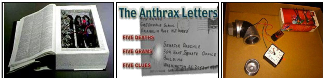
Bom buku, Anthrax dan bom paip

Perubahan corak keganasan juga dilihat mempengaruhi corak dan kaedah serangan pengganas pada ketika ini. Dengan pengaruh jihad dan doktrin radikal ekstremis mendorong anggota pengganas untuk melakukan serangan ke atas ‘musuh’ mereka dengan serangan berasaskan lone-wolf , IED, serangan berani mati, serangan menggunakan bom paip, bom buku dan serangan bio-toksin, yang menyasarkan bangunan kerajaan, kem tentera, balai polis, rumah ibadat, pusat hiburan dan pusat membeli-belah. Serangan sedemikian lebih bermotifkan kepada near dan far enemy bertujuan untuk mempengaruhi keputusan kerajaan antara lainnya untuk menghentikan kempen anti-keganasan.